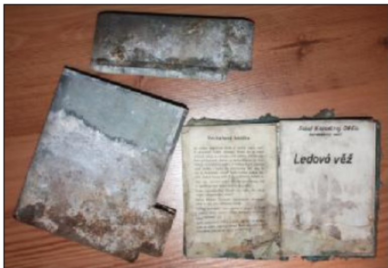
Nálezový stav i s původní zinkovou „skříňkou“.

Společně scházíme dolů na rozcestí. U stromu je skutečně opřená stará zinková krabice, obsahující jakési torzo knihy, které se raději ani neodvažujeme na místě rozevírat. Balím ji do krosny a rozbaluji až o několik hodin později v hřejivém zázemí útulného bytu.