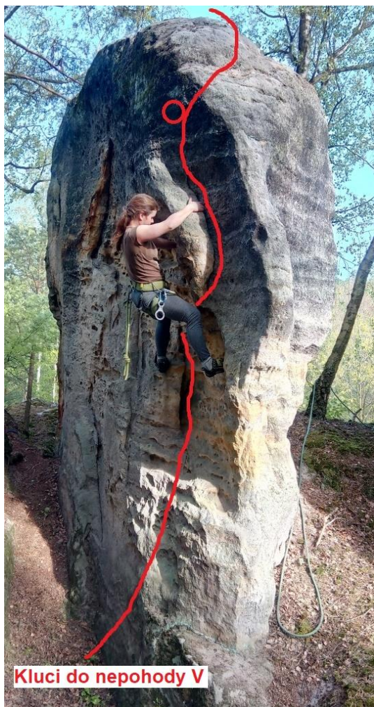
Kluci do nepohody V

V pravé části SZ stěny přes kruh na vrchol.